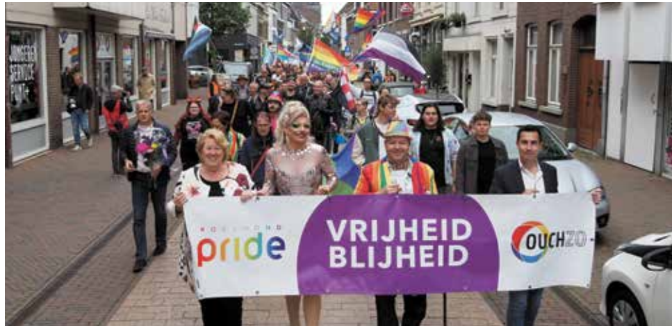
Roermond Pride 2024