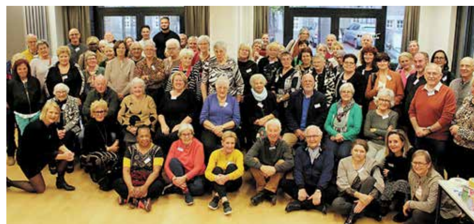
Groepsfoto tijdens de Dag van de Mantelzorg in 2023.