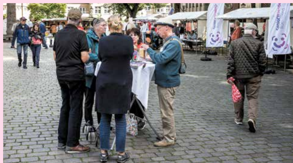
Feestelijke opening Doe Mee weken 2024.